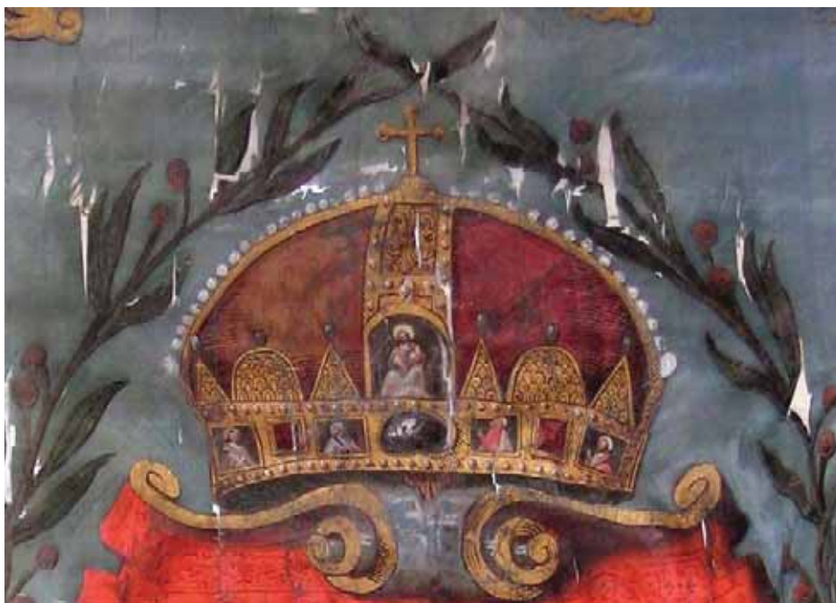
7. A Szent Korona a Magyar Királyság 1618. évi koronázási országzászlaján Fraknó, Esterházy Privatstiftung, Schatzkammer

Végül kiemelt figyelmet érdemel, hogy a címerpajzs felett a zászló mindkét oldalán a Szent Koronának egy tudunkkal ez ideig sohasem vizsgált, elülnézeti ábrázolása látható (7. kép), miként ez igaz az ordó zászlajának koronaképére is. Bár ezek természetesen komolyabb elemzést igényelnek, első vizsgálatra úgy tűnik, hogy jelentősebben eltérnek mind a Révay Péter 1613. évi művében, mind az „országablakon” látható koronaképektől, és leginkább talán a Jeszenszky János (Johannes Jesenius) II. Mátyás koronázásáról előbb kéziratban elkészült, majd 1609-ben nyomtatásban, nemrég pedig modern kiadásban is megjelent korona-változataihoz állnak legközelebb. 86 A fentiekben elmondottak ismeretében nem lehet kérdés, hogy mind a koronázási ordó, mind az országzászló festője számára a – zászló esetében különösen gondosnak nevezhető – koronaképhez a mintát egy olyan előkép vagy előképek (rajz vagy festett ábrázolás) szolgáltathatták, amelyek 1608 nyarán–őszén készülhettek. Nevezetesen a korona előbb Prágából Bécsbe, majd onnan Pozsonyba érkezése, majd a szertartást követően a koronáladába való visszahelyezése között. (Történetünk érdekességét ráadásul tovább fokozza, hogy a sokat idézett ordó külső oldalán a Szent Korona egyik legkorábbi hátulnézeti ábrázolása is megtalálható. 87 ) Azt azonban, hogy Jeszenszky és az 1618. évi