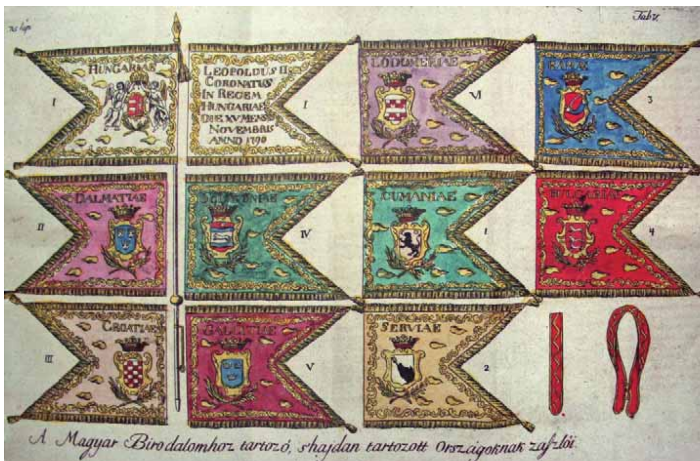
1. A Magyar Korona országainak koronázási zászlói II. Lipót 1790. évi pozsonyi koronázásán