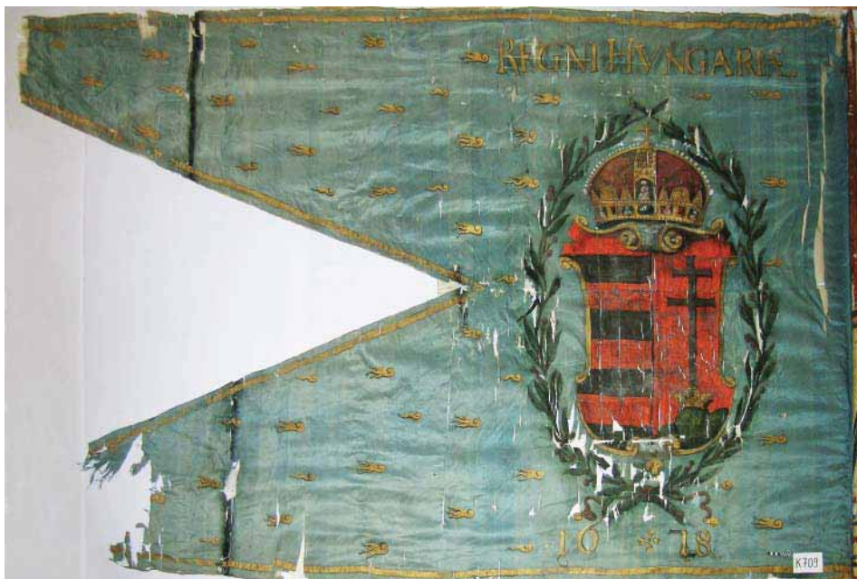
6. A Magyar Királyság Esterházy Miklós által vitt országzászlaja II. Ferdinánd 1618. évi pozsonyi koronázásáról

(1568–1628) III. Ferdinánd 1625. decemberi soproni koronázásának másnapján azonban feleségéhez (Polyxena z Pernštejna) írott spanyol nyelvű levelében majdnem sikerült. Ő csupán Galícia nevét hagyta ki, de hogy meglegyen a szokásos tíz országnév Ráma mellett Bosznia nevét is szerepeltette. 70 E hiba korábban a 16. századi királyi kettőspecséteken is előfordult. 71