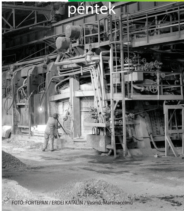
Vasmű, Martinacélmű