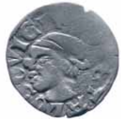
Nagy Lajos szerecsenfejes ezüst dénára (1350-es évek)