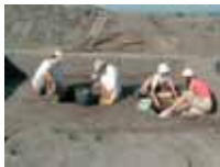
A helybeli munkások, a középiskolás diákok és az egyetemisták