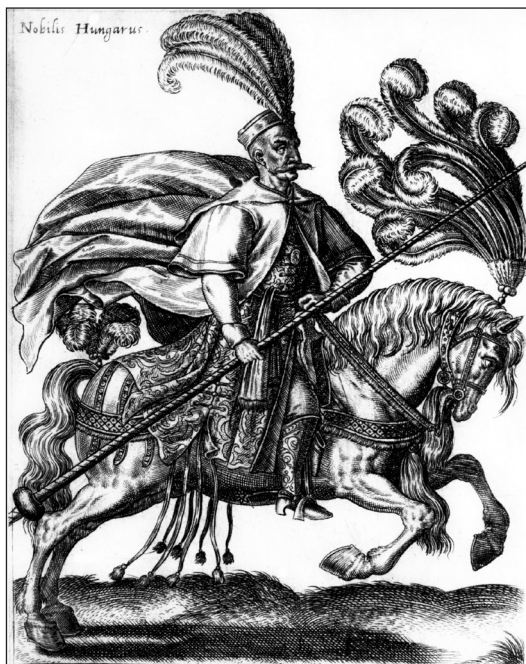
1. kép. Magyar nemes lóháton

maradt fiút a királyi udvarba küldték nevelkedni, amire maga is utal történeti munkájában. Közvetett forrásból feltételezhető, hogy Luis Hurtado de Mendoza y Pacheco (1489–1566), Mondéjar őrgrófja, navarrai alkirály környezetében is feltűnhetett apródként. 4 Ifjú udvaroncként aztán V. Károly szolgálatában különféle feladatokat látott el, eleinte az udvarban, majd pedig különböző katonai vállalkozásokban és diplomáciai küldetésekben. 1529–1530-ban ott volt Károly kíséretében az itáliai körútján és a bolognai császárkoronázáson. 1530 decemberében Ávila addigi szolgálatai jutalmául az uralkodótól megkapta a spanyol Santiago lovagrend kormányzóságát, 1534-ben V. Károly burgundiai kamarása lett. Katonai vezetőként elkísérte a császárt 1532-ben a Bécs felmentését célzó hadjáratba, a tunéziai (1535) 5 és a provençei (1536) hadjáratokba.