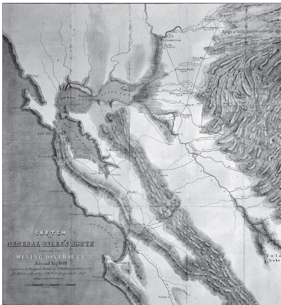
3. kép. Bennet Riley tábornok térképvezlata, 1849

Montgomery utcán, ezt kiáltozva: „Arany! Arany az American folyónál!” A nyolcszázötven lakosú városból (1. kép) két héten belül valamennyi egészséges férfi eltűnt, a helyi lap pedig előfizetők híján megszűnt. Júliusban egész Kaliforniában elterjedt a hír, melynek következményeit így idézte fel egy San Franciscó-i újság: „Az egész vidék, San Franciscótól Los Angelesig, a tengerparttól a Sierra Nevada lábáig, visszhangzik a mohó kiáltozástól: Arany, arany, arany! A földet félig bevetetlenül, a házat félig felépítve hagyják, és mindent elhanyagolnak a lapátok és csákányok készítésén kívül.” 2