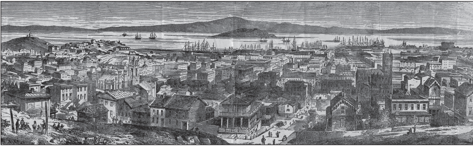
4. kép. San Francisco 1860-ban

A Csendes-óceán kereskedőhajói először a kontinens nyugati partján és a szigeteken terjesztették el a nagy újságot. Oregon férfilakosságának a fele megindult délre, a mexikóiak, peruiak és chileiek pedig észak felé vándoroltak. Megérkeztek az első bennszülöttek Hawaiiról, a francia fennhatóság alatt álló Marquiseszigetek teljes helyőrsége pedig faképnél hagyta a kormányzót és hajóra szállt. Az Egyesült Államok keleti részére 1848 augusztusában érkeztek meg az első híresztelések, decemberben pedig befutott Washingtonba az első küldemény: egy teásdoboz, háromszáz uncia arannyal megtöltve!