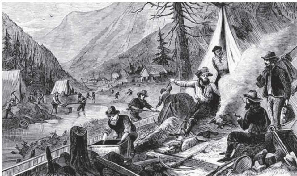
5. kép. Aranyásók tábora