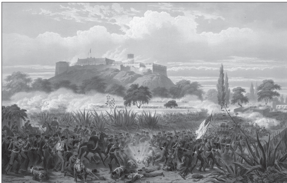
4. kép. Chapultepec várának ostroma

Mexikó második legnagyobb városát, a nyolcvanezres Pueblát. Innen közel három hónap múlva indult csak tovább. Meg kellett várnia az utánpótlást mind katonákban, mind ellátmányban. Seregéből közel háromezren kerültek kórházba, nem csupán a harc közben szerzett sebesülés, hanem különböző járványok következtében is. Mexikói oldalon sem volt jobb a helyzet. A megtépázott sereg, a kormány belső vitái, az egyes területek elszakadásáról szóló híresztelések és kisebb-nagyobb lázadások hasonlóképpen kivárára készítették őket, s nem született döntés Mexikóváros megerősítéséről sem. 21 Winfield Scott végül 1847 augusztusában indította útjuk csapatait a főváros felé. Miután benyomult a Mexikó-völgybe, Mexikóváros ellenállását több ütközetben törte meg. Győzelmet aratott Padiernánál, Contrerasnál, majd 1847. augusztus 20-án Churubuscónál (3. kép). Legendás történet, ahogyan a mexikói Nemzeti Palotát, Chapultepec várat a végsőkig védték az ott működő kadétiskola növendékei, a „Hős Fiúk” ( Los Niños Héroes ), de hiába (4. kép). 22 A szeptember 13-i győzelmet követően az amerikai sereg bevonult Mexikóvárosba.