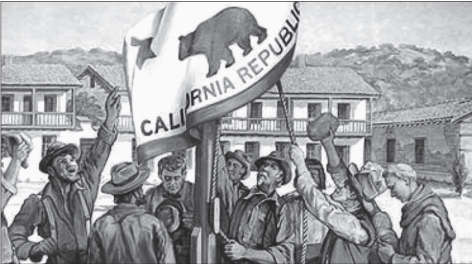
1. kép. A medve zászló felvonása

Itt érdemes megjegyezni, hogy 1847 decemberében az akkor még fiatal whig képviselő, Abraham Lincoln megkérdőjelezte, hogy a mexikóiak valóban amerikai földön ontottak-e vért. A Kongresszusban felszólította Polk elnököt, hogy nevezze meg a pontos helyet, ahol az amerikaiakon rajtaütöttek, és bizonyítsa be, hogy az valóban amerikai föld volt, vagy inkább Mexikó formálhatott rá jogot. A felvetést végül sosem tűzte napirendre a Képviselőház, de nyilvánvalóvá tette a whigek álláspontját a háború kitörésének körülményeivel és az amerikai hadüzenettel kapcsolatban. 15