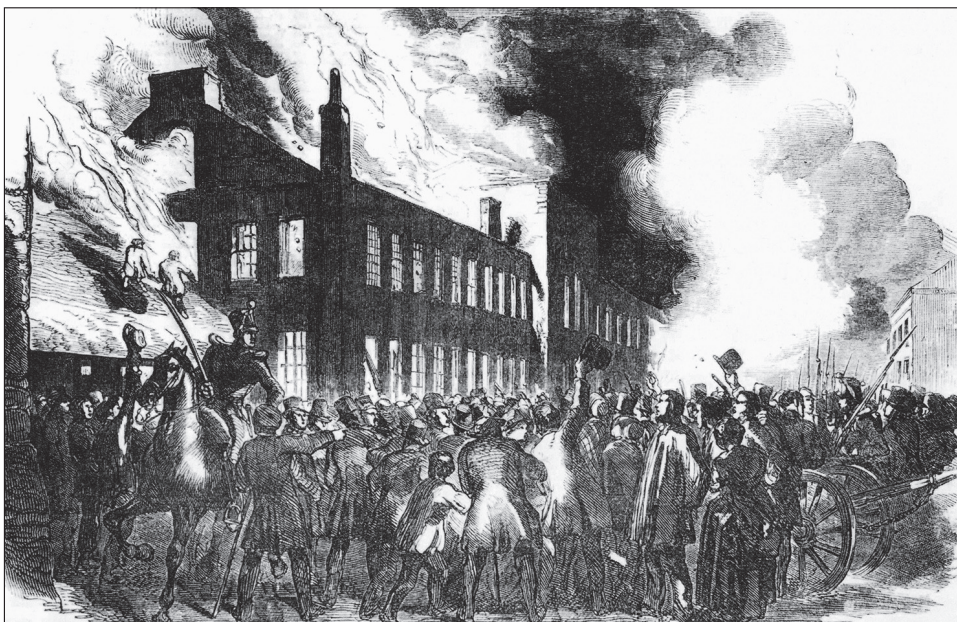
4. kép. A montreali törvényhozás égő épülete a London Illustrated News hasábjain

futottak. A csőcselék betört az épületbe és összetörte a berendezést. Valaki beült a házelnök székébe és elordította magát: „A házat felosztatom!” Nemsokára lángokban állt az épület, és reggelre már csak az üszkös falak álltak (4. kép).