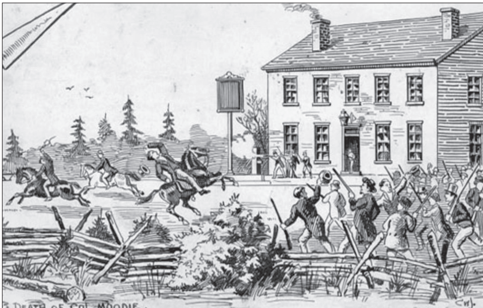
2. kép. Ütközet Montgomery kocsmájánál

különleges testület ( Special Council of Lower Canada ) vette át, amely egészen 1841 februárjáig hivatalban maradt.