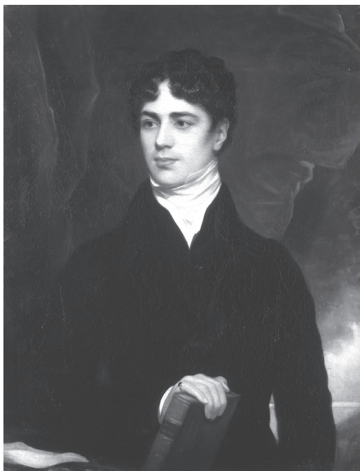
3. kép. Lord Durham

zás az volt, hogy a két tartomány egyesítésével a francia kanadai kulturális jelenlét asszimiláció útján fokozatosan eltűnik majd. Ennek megfelelően az Egyesülési Törvény korlátozta a francia nyelv használatát a Törvényhozó Gyűlésben. Bár Kanada az egyesülést követően elvben egységes formában működött, a gyakorlatban mégis két különálló részre oszlott, Nyugat-, illetve Kelet-Kanadára, lényegében a korábbi Felső- és Alsó-Kanada határait követve. A közös törvényhozásban a 450 ezer fős lakossággal rendelkező Nyugat-Kanada ugyanúgy 42 helyet kapott, mint a 650 ezer főnyi lakosságú Kelet-Kanada. Ezzel a ravasz megoldással sikerült elérni, hogy az angol nyelvű lakosság nagyobb többségbe került a testületben, mint ahogyan azt a létszámarány indokolta volna. Ráadásul a korábbihoz képest az Egyesülési Törvény olyan magas vagyoni cenzust alkalmazott a passzív választójog esetében, amely a francia kanadaiak jelentős többségét eleve kizárta a potenciális képviselőjelöltek köréből. Mindazonáltal az Act of Union mindkét ország részben hatályban tartotta a korábban elfogadott törvényeket és az alkalmazott jogot.