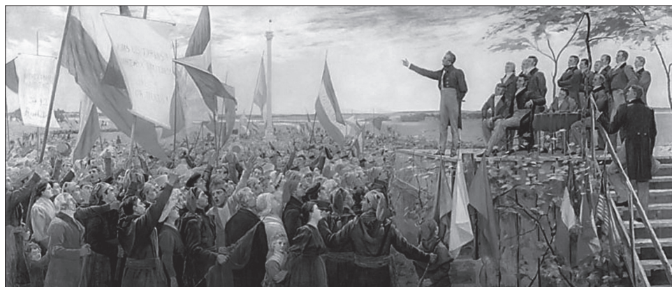
1. kép. Papineau szónokol a saint-charles-i gyűlésen. Charles Alexander Smith festménye

A katonai vereségeket követően a főbb rebellis vezetők az Egyesült Államokba menekültek, ahonnan amerikai szimpatizánsok segítségével még egy teljes éven keresztül fegyveres betöréseket hajtottak végre. A harcok 1838 novemberében mindkét tartományban a felkelők vereségével értek véget (Felső-Kanadában Prescottnál, Alsó-Kanadában pedig Beauharnois-nál). A felkelők vezetői közül néhányat kivégeztek, másokat deportáltak. Olyanok is akadtak, akik az Egyesült Államokban maradtak, ahonnan később amnesztiával térhettek vissza Kanadába. Alsó-Kanadában felfüggesztették az Alkotmányos Törvényt, 1838 áprilisában feloszlatták a törvényhozás mindkét házát, a Végrehajtó Tanács szerepét pedig egy