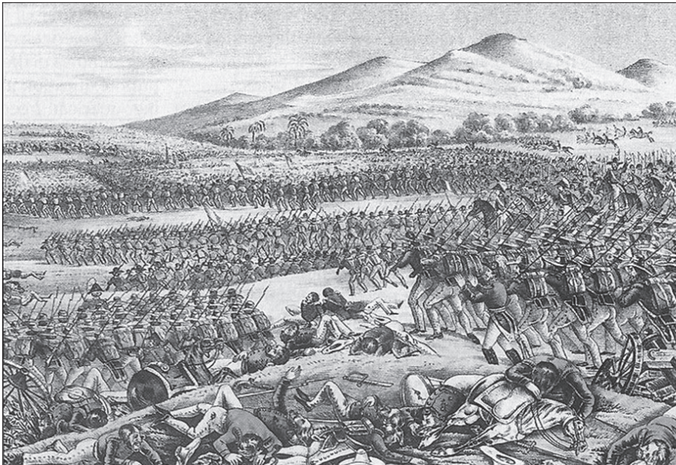
1. kép. A Buena Vista-i csata

Az amerikai kormány eredeti háborús célja a korábban kiszemelt mexikói tartományok megszerzése volt, és úgy vélte, ezek elfoglalása után, néhány fontos katonai győzelem eredményeként a mexikóiak kapitulálni fognak és teljesítik a már korábban megfogalmazott amerikai követeléseket. Erre azonban nem került sor azután sem, hogy az amerikai csapatok Új-Mexikót és Kaliforniát is ellenőrzésük alá vonták, ezért Polk elnök úgy döntött 1846 nyarán, hogy az eredményes békekötés reményében az új hadicél Mexikóváros elfoglalása. Haderőt csoportosítottak át