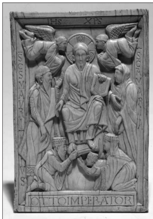
2. kép. Szent Móric és a császári pár gyermekével Krisztus előtt

„Ekkor az itáliai jogainak semmibevétele miatt felszólította minden hűbéresét a neki járó elégtétel megadására, majd úgy döntött, hogy a küszbönálló böjti időszakban maga vonul a csapatai élén oda. Merseburgból való megindulása után először Magdeburgba ment, ahol Isten előtti közbenjárásért és a hadjárat szerencsés kimenetelért Szent Mórichoz imádkozott.” 16