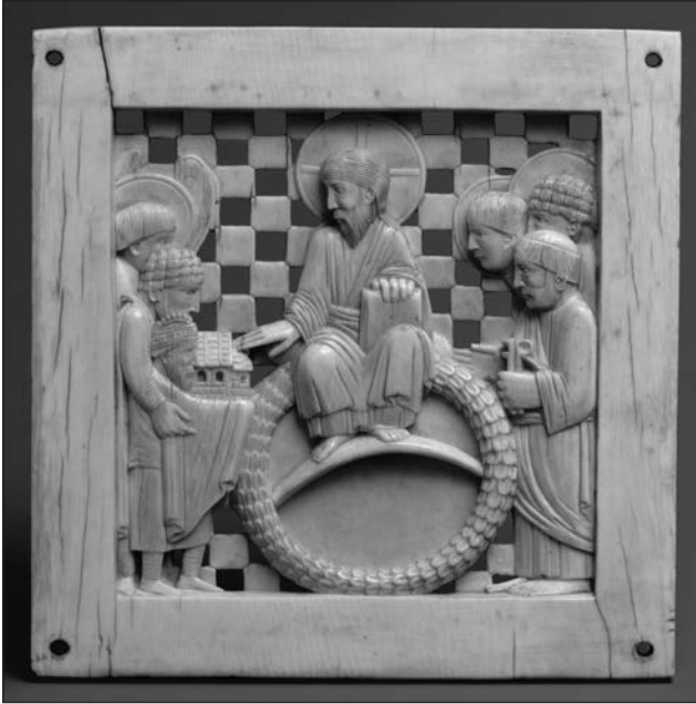
1. kép. Szent Móric Szent Péter és az angyalok társaságában Krisztus elé vezeti I. Ottó német-római császárt, hogy felajánlja a magdeburgi székesegyházat

Ezen az ábrázoláson Móric nem harcos figura, és a milánói Castello Sforzesco híres elefántcsont faragványán sem mint katona jelenik meg (2. kép). 12 A trónon ülő Krisztus – akinek feje mellett kétfelől angyalok láthatók – előtt áll, Krisztus jobbján, szemben Máriával. Krisztus alakja alatt egy császári párt láthatunk megkoronázott fiúgyermekével. Az elefántcsont faragványra az alábbi szavakat vésték: „OTTO IMPERATOR”. 13