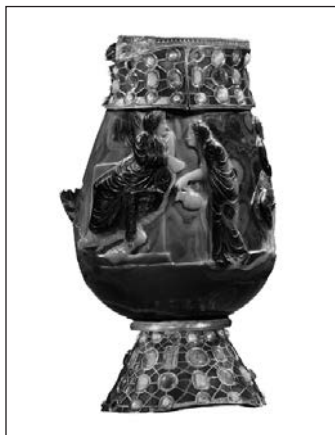
2. kép. Szent Márton vázája, Kr. e. 1. század – Kr. u. 5. század (Apátsági kincstár, Saint Maurice d’Agaune)