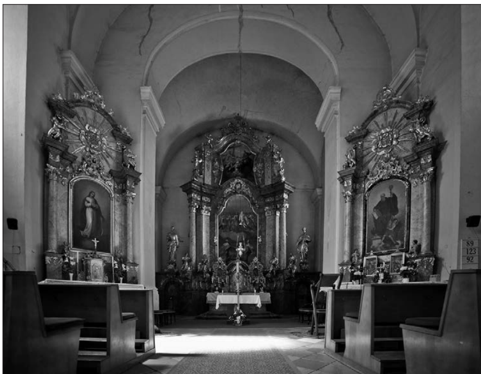
5. kép. A templom belseje

Mivel Móric a középkori lovagi eszmény megtestesítője volt, neve Szent György és Sebestyén mellett a lovagi kard megáldásának liturgikus szövegében is szerepelt. Tisztelete emiatt nemritkán előkerül olyan, a bakonybéli monostorhoz köthető oklevelekben, melyeket valamelyik lovagkirályunk jegyzett. Szép példa erre Nagy Lajos 1374 novemberében kelt kiváltságlevele, melyben a király tanúságot tesz „a Boldog Móricba, Krisztus katonájába vetett reményéről és iránta való buzgóságáról, akinek dicső nevére szentelték a béli monostort”. 35