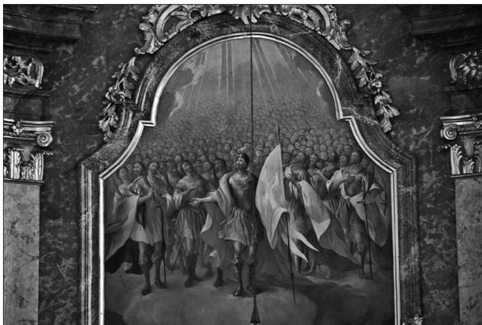
6. kép. A templom főoltárképe (részlet)

XIII. Ince pápa 1723-ban kelt bullájában a „Szent Móric, Exuperius, Candidus, Victor, Innocentius, Vitalis és vértanútársaik plébániatemplomában” a vértanúk ünnepe, illetve az azt követő vasárnapra teljes búcsú elnyerését engedélyezte a Bakonybélbe zarándoklók számára. 37 A monostor és a születő falu fejlődése szempontjából nem kis dologról van szó, főleg ha arra gondolunk, hogy ekkor még csak egy szerény fatemplom állt a völgy közepén.