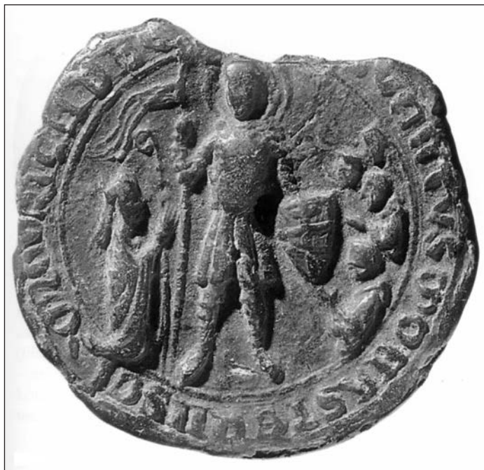
4. kép. A bakonybéli apátság pecsétje

A török kor előtti időkből Bakonybél mellett csak néhány olyan helységről tudunk, ahol Szent Móricnak szentelt templom állt, s mindet Veszprém megyében találjuk: Béb község, egy Berzsény nevű, elpusztult falu Tüskevár mellett és Hidegkút Veszprém közelében. 33 A török hódoltság után azonban, ha újjá is épültek ezek a templomok, már más védőszent tiszteletére emelték őket. Bakonybélen kívül egyedül a Zala megyei Csesztreg 13. századi Móric-temploma őrzi mind a mai napig ezt a titulust, ahová valószínűleg a bajor felmenőkkel rendelkező, alsó-lendvai Bánffy családdal való középkori kapcsolat miatt került a thébai katona kultusza.