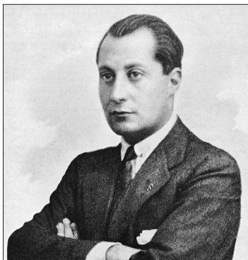
1. kép. José Antonio Primo de Rivera, a „hiányzó” vezér és mártír