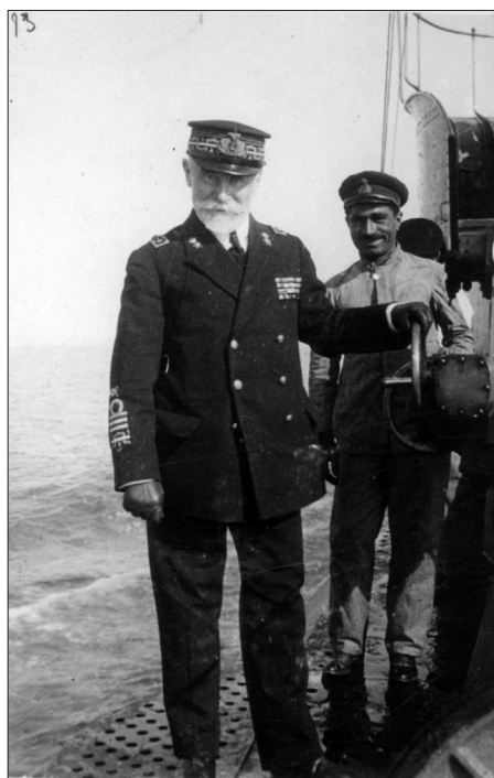
2. kép. Paolo Thaon di Revel admirális hadiszemle közben

gabb és legtermékenyebb részétől, valamint olyan helyzetet kell teremteni, amely lehetővé teszi az olasz katonai fölény biztosítását az adriai vizeken (1. kép). Erre vezethető vissza a Dél-Tirol, Dalmácia egy része és Közép-Albánia ellenőrzésére vonatkozó igény. 9