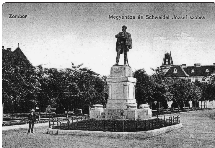
4. kép. A zombori Megyeháza tér a Schweidel-szoborral egy korabeli képslapon

utóbb a társadalmi kötelezettségek nagymértékű megszorodásával magyarázta. 109 Mindenesetre a jegyző állítása szerint – a hírlapi tudósításnak ellentmondva – 1910 őszére közel 20 ezer korona gyűlt össze, s 3000 az ünnep megrendezésének költségeire. 110 Nem tudjuk pontosan, mi történt, de a pénzalapot néhány nap alatt majdnem a duplájára tornázták fel, s talán nem járunk messze az igazságtól, ha feltételezzük, hogy a lokálpatrióták ekkor szánták el magukat nagyobb összegű adományaik befizetésére. Ugyanis, ha megnézzük a befolyt összegek kimutatását, valamint a befizetők nevét, 111 kiderül, hogy a helybéli politikusok, közszereplők, birtokosok fizették be a legnagyobb összegeket az alapba, s nem a gyűjtés kezde- tekor, hanem annak lezárulta előtt néhány héttel.