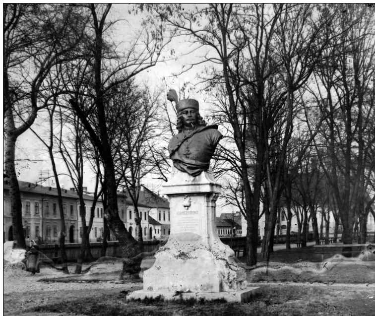
1. kép. A zólyomi Rákóczi-szobor, 1907

Az avatási ünnepséget megelőzte egy előzetes ceremónia (1. kép). 25 Május 27-én a szobor talapzatába egy fémtokban elhelyezték a keletkezésének történetéről szóló iratot, 26 továbbá az akkori pénznemek és a mozdonyvezetők utolsó lapjának egy-egy példányát, valamint egy listát, amely a szobor felállítására adakozó vasutasok nevét és az adományozott összegeket tartalmazta. 27 Az okirat elhelyezésénél megjelölt Skrovina Mátyás, Zólyom város polgármestere, a város korábbi főjegyzője, Petheő Tivadar, a zólyomi szoborbizottság összes tagja, valamint „nagyszámú közönség”. 28 Ezekben a napokban kiderült, hogy a zólyomiak joggal számíthatnak országos jelentőségű szoboravatóra, mivel Magyarország minden pontjáról 137 egyesület jelezte május 29-én, hogy képviselőket küld, ami egyetlen nap alatt 360-ra nőtt. Ugy tűnt, a hajdúsági Bocskai-szoboravatót teljesen elhomályosítja a zólyomi Rákóczi-mellszobor leleplezése. Kilátásba helyezte részvételét Kossuth Ferenc és Justh Gyulán kívül gróf Apponyi Albert kultuszminiszter és Jekelfalussy Lajos honvédelmi miniszter is – utóbbi a zólyomi választókerület országgyűlési képviselője is volt –, valamint legalább 15 felsőházi képviselő. 29 Június 1-jén azonban kiderült, hogy az országgyűlés sokkal fontosabb – vagy, mint látni fogjuk, politikailag kevésbé kockázatos – eseménynek minősítette a hajdúböszörményi szoboravatót, ezért ott jelentek meg a legfőbb potentátok. Olyannyira, hogy például még a Rákóczi-