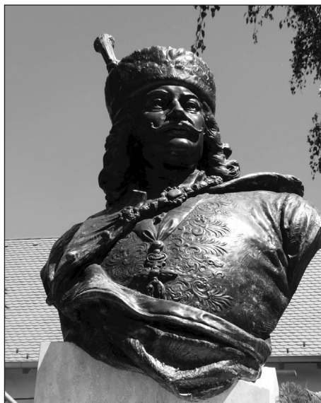
2. kép. A Zólyomban 1907-ben leleplezett Rákóczi-szobor ma Borsiban

A Brassói Magyar Újság című napilap 1907. október végén a következő csalódott híradást tette közzé: Marosvásárhelyen „Holnap délelőtt lepezik le II. Rákóczi Ferencnek, a halhatatlan emlékü erdélyi fejedelemnek a mellszobrát. Talán nagyobb ünnepség és pompa illette volna meg ezt az ünnepséget, mert ez a szobor Erdélyben még csak az első és széles hazában a második emlékmű, mely a fejedelem nagyságát és dicsőségét hirdeti. Talán mégsem kellett volna ennek az ünnepélynek kizárólag helyi jellegűnek lennie. El kellett volna terjedjen a híre, hogy Erdély szabad népe milyen fénnel ünnepli a szabadság lánglelkű harcosának dicső emléket.” 58 A várva várt esemény – noha országos jelentőségű társadalmi-politikai megmozdulásként indult, mint minden ilyen jellegű kezdeményezés az 1903-as évfordulót követő időszakban – valóban nem váltotta be a hozzá fűzött reményeket, mivel jócskán megkésett (négy évig készítették elő).