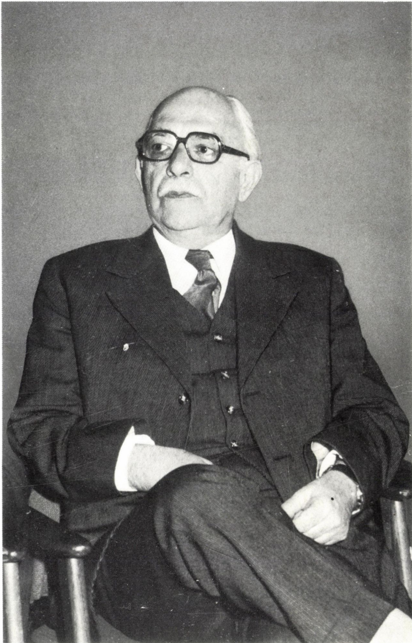
Pach Zsigmond Pál akadémikust, az MTA Történettudományi Intézetének igazgatóját 65. születésnapján e számmal köszönti a Történelmi Szemle szerkesztősége.