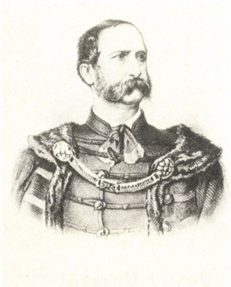
Maithényi László báró , 1842-től 1845-ig Hont vármegye tiszteletbeli főjegyzője, 1845-től 1849 elejéig a megye első alispánja, majd 1849-ben Nógrád vármegye császári biztosa Litográfia (TKCs)