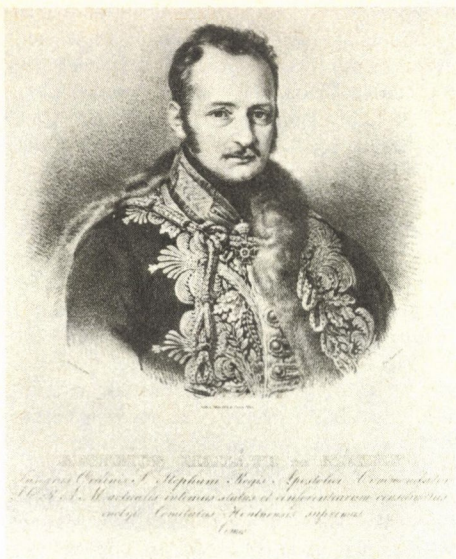
Mailáth György országbíró, 1828-tól 1848-ig Hont vármegye főispánja Johann Clarot litográfiája Alexander Clarot festménye alapján (TKCs)