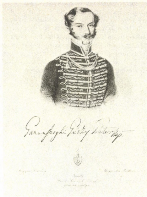
Géczy Péter, 1848–49-ben Hont vármegye főispánja és 1848 őszéig az alsó-magyarországi bányakerület kormánybiztosa Litográfia Ponori Thewrewk József Magyar Pantheon című sorozatából (TKCs)

S mivel közben, május derekán a forradalom táborának baloldala – s azon belül Teleki is – újabb és minden korábnál szenvedélyesebb támadást intézett a kormánypolitika ellen, 30 a levélírás egyben arra is kiváló alkalmat szolgáltatott a honti uraknak, hogy még egyszer kinyilvánítsák a kormánypolitika iránti állítólagos hűségüket s még egyszer elhatárolják magukat azoktól, akik – mint oly magasztos költőiséggel (s persze megint a Telekire történő egyenes utalás mellőzésével) megfogalmazták – „feledve vagy át nem látva az idő viharzó hullámainak veszélyét, ezredéves hajónkat – a mi kedves hazánkat – maga a vész közepette gyökerestül átalakítani ohajtanák a nélkül, hogy az előbb a legközelebb eső partot érve, csak kissé is megerősíthetnék, mielőtt a végkép elmerüléssel fenyegető idő tengerére bocsájtatnék”. 31 Ennek a szívhez szóló irománynak a postázása után pedig Maithényi és társai nyilván már akár mérget is mertek volna venni arra, hogy a forradalmi kormányzat többé végleg nem fogja háborgatni őket megyéjük ügyeinek tetszésük szerinti intézésében.