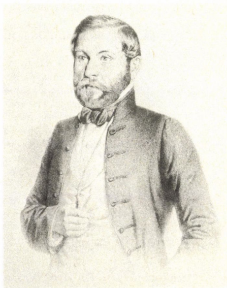
Gyürky Antal , 1842-től 1845-ig Hont vármegye bozóki járásának ellenzéki pártállású alszolgabírája, majd 1845-től 1848-ig a megye konzervatív pártállású másodfőjegyzője Molnár József litográfiája, 1858 (TKCs)