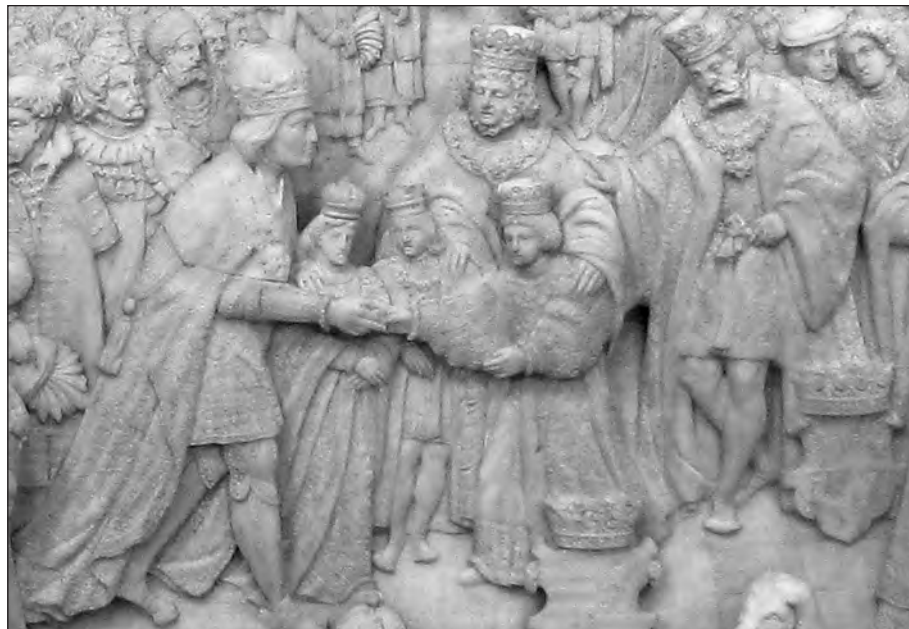
18. kép. I. Miksa síremlékének 23. reliefe. Az 1515. évi bécsi kettős eljegyzés. Innsbruck, Hofkirche.