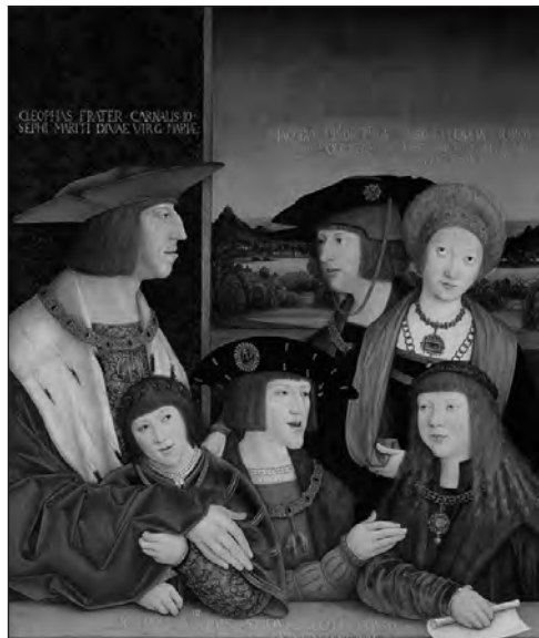
7. kép. Bernhard Strigel: