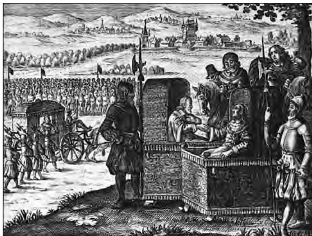
14. kép. Sigmund von Birken: Spiegel der Ehren des Höchstlöblichsten Kayser- und Königlichen Erzhauses Oesterreich... Nürnberg, 1668. 1325. [Könyvillusztráció, rézmetszet.] (Lásd 70. j.)

mannsdorf an der Leithe melletti mezőn 1515. július 16-án történt ünnepélyes találkozásáról egy illusztrációt is találunk (14. kép), 71 amelyen a lovon ülő, hosszú hajú II. Lajos és a szakállas I. Zsigmond, illetve az egymással szembefordított gyaloghintókban elhelyezkedő II. Ulászló és I. Miksa látható.