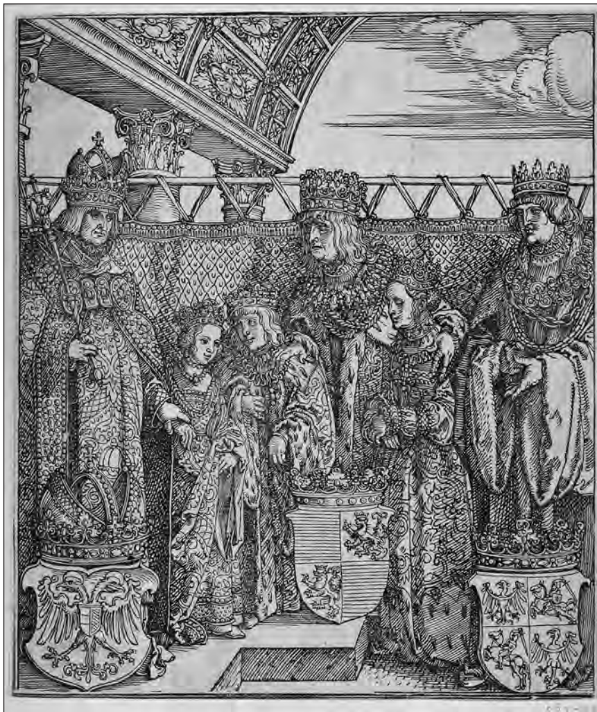
11. kép. I. Miksa Diadalkapuja [Ehrenpforte Maximilians I.]. Az 1515. évi bécsi kettős eljegyzés. 1515–1517, fametszet, részlet. (Legutóbbi megtekintés: 2024. május 27.)