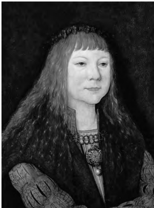
6. kép. Bernhard Strigel: II. Lajos gyermekkori portréja . Bécs, 1515–1516, olaj, fa, 29 × 22,2 cm.

Kunsthistorisches Museum. Gemäldegalerie. Ltsz. 827.