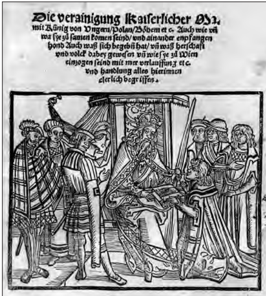
1. kép. Die verainigung Kaiserlicher Ma. mit König von Ungern, Polen, Boehem aus dem Jahr 1515. [Augsburg, 1515.] Wienbibliothek. Druckschriftensammlung. E-172229. [Címlapkép, fametszet.] (Lásd 16. j.)

nyelvű hírlevél címlapján a baldachinos trónon ülő, feltehetően udvarnokokkal és követtekkel körülvett I. Miksát látjuk, aki egy térdelő ifjúnak egy irattekercset nyújt át vagy vesz át tőle (1. kép). 16