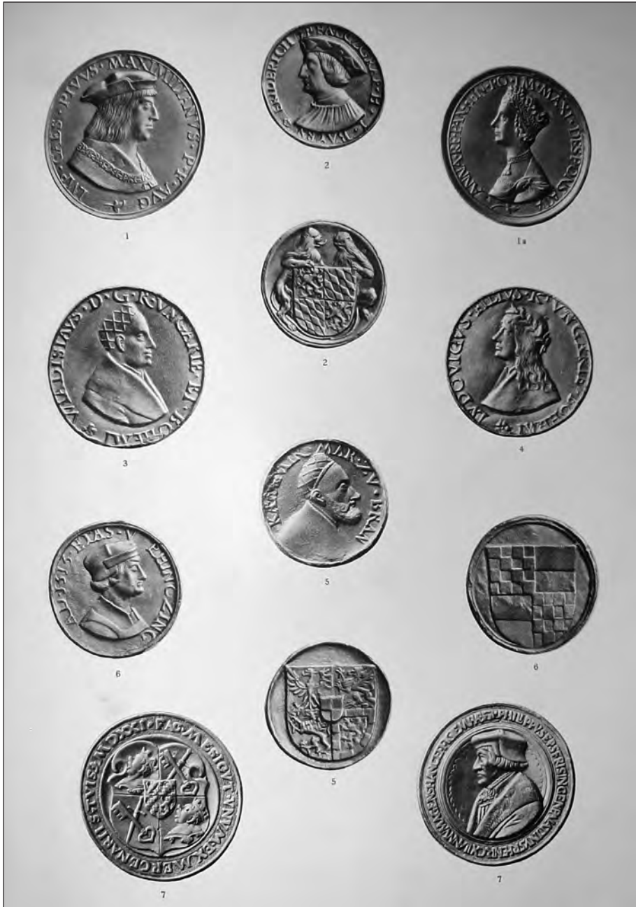
10. kép. Georg Habich: Die Deutsche Schaumünzen des XVI. Jahrhunderts. [Erster Teil, Erster Band, Erster Halfte.] München, 1929. V. tábla. (Lásd 49. j.)