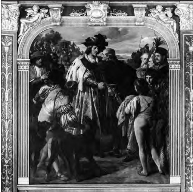
24. kép. August Eisenmenger: Az 1515. évi bécsi királytalálkozó. Schloss Hernstein, 1870 körül.

tott kastélyt 1830-ban Rainer főherceg (1783–1853) szerezte meg, majd az 1850-es évek második felében fia, Lipót Lajos főherceg (1823–1898) – I. Ferenc József (1830–1916) unoka-öccse – megbízásából Theophil von Hansen (1813–1891) tervei szerint historizáló (angol gótika) stílusban vadászkastéllyá építették át. Az 1870-es években készített, az Ahnensaal falain elhelyezett, vászonra festett olajfestmények – az első jelentős 19. századi dinasztikus portrészorozat – a Habsburg-ház tagjait örökítették meg I. Rudolftól (1218–1291) II. Ferdinándig (1578–1637), illetve III. Lipót (1351–1386) osztrák herceg és I. Miksa esetében az életükből vett egy-egy fontos jelenetet mutattak be. A művész III. Lipótot egy 1376-ban rendezett bázeli ünnepség, míg I. Miksát az 1515-ös királytalálkozó aranybrokát-hermelin palástot viselő központi szereplőjeként ábrázolta, mindkét esetben hangsúlyozva a diplomáciai kapcsolatok fontosságát a birodalom építésében (24. kép). 116