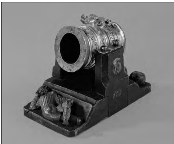
4. kép. Ágyúmodell. Bécs, 1515. Kunsthistorisches Museum. Hofjagd- und Rüstkammer.