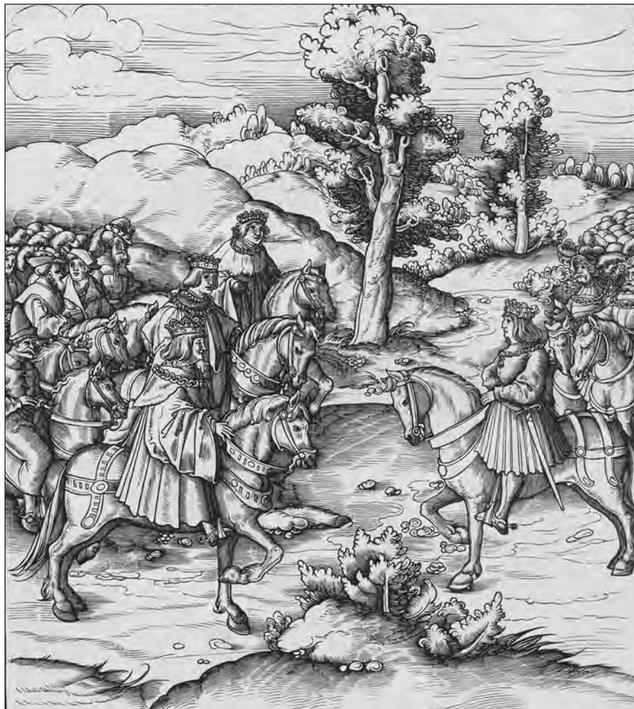
17. kép. Királyok találkozása. 1514–1516 körül, fametszet. Der Weisskunig.