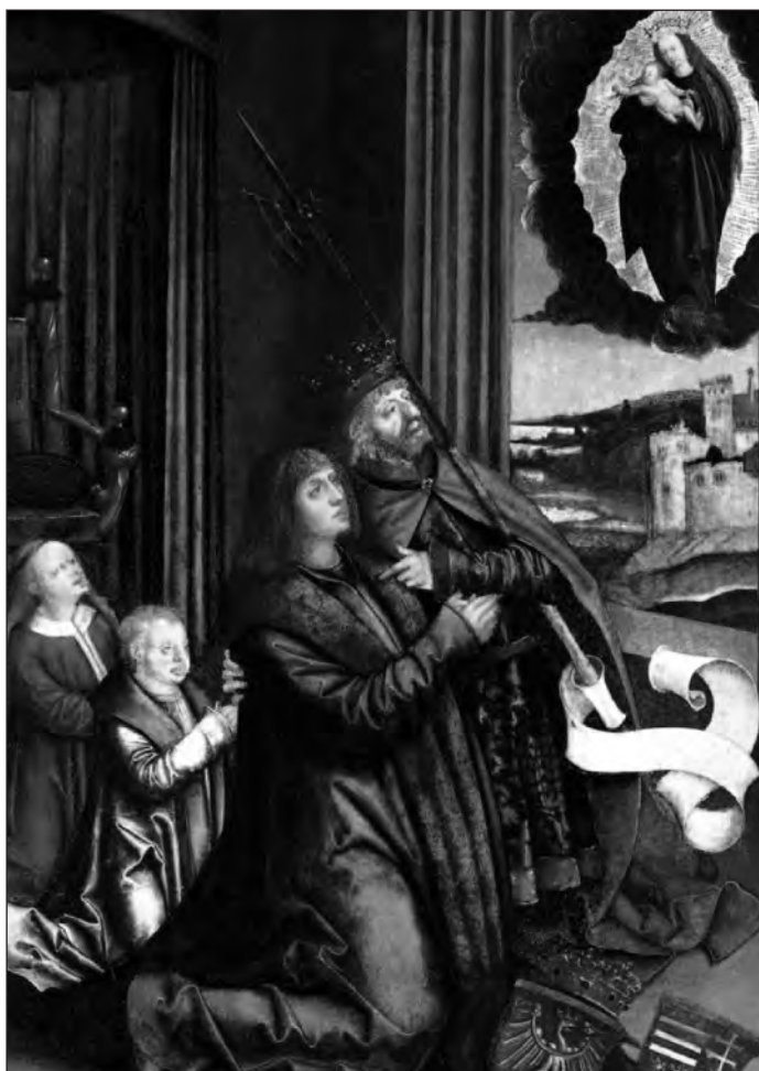
5. kép. Bernhard Strigel: II. Ulászló fogadalmi képe. 1515 körül (?), olaj, fa, 43 × 30,8 cm. Szépművészeti Múzeum. Ltsz. 7502. (Lásd 31. j.)