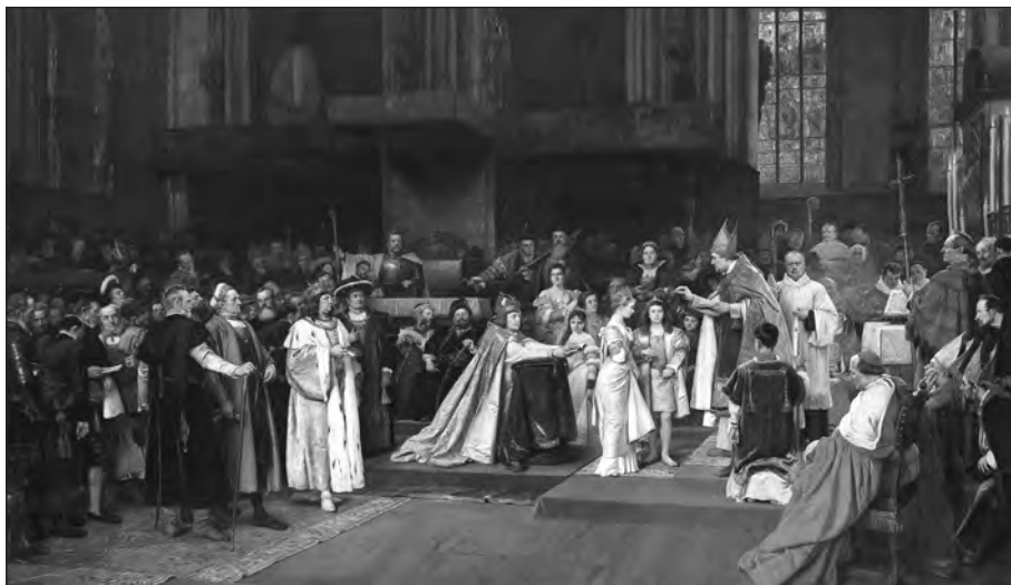
25. kép. Václav Brožík [Wenzel von Brozik]: Tu felix Austria nube . Prága, 1896, olaj, vászon, 430 × 730 cm. Belvedere. Ltsz. 2768a-b. (Lásd 120. j.)

A kiadványban az Ahnensaal ról több kép is szerepel. Egy színes nyomat Franz Alt akvarellje alapján a dísztermet ábrázolja, míg Ludwig Michalek 1880 körül a saját rajzai alapján készített két metszeten a festményeket – köztük az 1515-ös királytalálkozót bemutató jelenetet –, egy harmadikon pedig az Eduard Bitterlich (1833–1872) által festett mennyezeti freskó díszítését láthatjuk J. Kaiser rajza nyomán. Hernstein kastélyának gyűjteményében található Eisenmengernek a Habsburg-portrékhoz készült előtanulmányai. 118