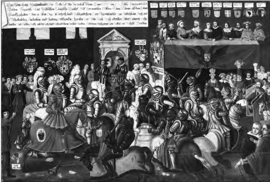
13. kép. Lovagi torna Sigmund von Dietrichstein és Barbara von Rottal esküvője alkalmából 1515-ben. 17. század, olaj, vászon. Steiermärkisches Landesmuseum Joanneum [Graz].

Az 1515. évi bécsi kongresszusról, a kettős eljegyzésről, illetve a Dietrichstein-Rottal-féle esküvőről és a hozzá kapcsolódó lovagi tornáról az Ehrenspiegel des Hauses Österreich című, a müncheni Bayerische Staatsbibliothekben őrzött, Clemens Jäger 68 (1500 körül – 1561) által 1555–1559 körül a Fugger család számára összeállított, több száz miniatúrával illuminált, szépírásos krónika, 69 illetve ennek 1686-os nyomtatott kiadása is beszámolt. 70 Utóbbiban I. Miksának, II. Ulászlónak és I. Zsigmondnak a Traut-