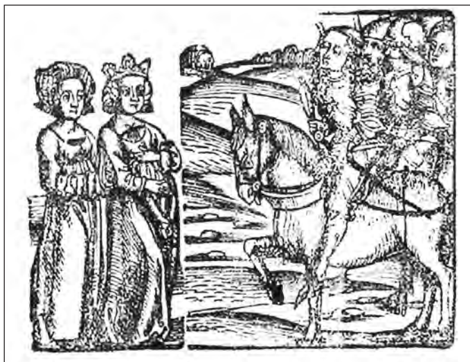
3. kép. Keiserlicher Maiestat ynreitung zů Wien. mit dem König von Vngern/ vnd König von Polen/mit sampt den Küniginen... Straßburg, 1515. [Könyvillusztráció, fametszet.] (Lásd 17. j.)