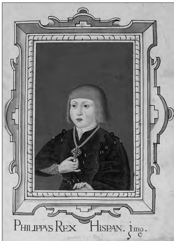
9. kép. II. Lajos (?). Bécs, 1570–1590-es évek, miniatúra. In: Hieronymus Beck von Leopoldsdorf: Porträtbuch. Kunsthistorisches Museum. Gemäldegalerie. Ltsz. 9691.

II. Lajos két fenti gyermekportréjához hasonló ábrázolást találunk Hieronymus Beck von Leopoldsdorfnak 48 a bécsi Kunsthistorisches Museum Gemäldegalerie-ben őrzött, az 1570–1590-es években készült, 240 miniatúrát (akkor még létező festmények másolatait) tartalmazó, 53 × 37 cm nagyságú, bőrkötéses Porträtbuch -jában is (9. kép). 49