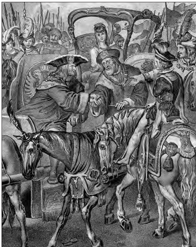
21. kép. Vaterländische Immortellen aus dem Gebiete der österreichischen Geschichte, der alten, mittleren, neuern und neuesten Zeit gesammelt... Hrsg. Anton Ziegler. Wien, 1839. 82. kép. (Lásd 113. j.)

A 91 illusztrációt tartalmazó kötetben több önálló írást találunk I. Miksa életéről és uralkodásáról: az eljegyzési jelenet az 1513 és 1518 közötti eseményeket bemutató szövegrész előtt kapott helyet. 112