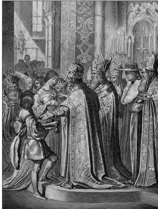
20. kép. Gallerie aus der Österreichischen Vaterlandsgeschichte in Bildlicher Darstellung . Hrsg. Anton Ziegler. Wien, 1837. 48. kép. [Könyvillusztráció, litográfia.] (Lásd 111. j.)

A kettős eljegyzés jelenete szerepelt egy Anton Ziegler (1793–1869) által 1837-ben, illetve 1838-ban megjelentetett történeti kiadványban is, az ábrázolás azonban inkább az I. Miksa és Jagelló Anna közötti ceremóniára koncentrált, II. Lajos és Habsburg Mária a központi jelenet mögött csak mellékszereplőként tűnik fel (20. kép). 111