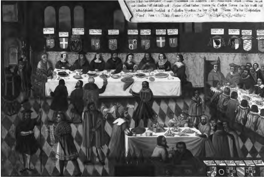
12. kép. Sigmund von Dietrichstein és Barbara von Rottal esküvői lakomája 1515-ben. 17. század, olaj, vászon, 143 × 199 cm. Universalmuseum Joanneum [Graz] Alte Galerie. Ltsz. 1258. ( https://www.museum-joanneum.at/museum-fuer-geschichte/entdecken/kulturgeschichte-online/die-reformation . Legutóbbi megtekintés: 2024. május 30.) (Lásd 63. j.)

„Az ábrázoláson Ulászló király, átöelve gyermekeit, Lajost és Annát, Miksa császárnak ajánlja és adja át őket. A császár pedig unokáját, Máriát vezeti Lajoshoz. A magyar királyi család portréi sematikusak, semmiképpen sem tekinthetők modell után készült képmásoknak, csupán a császár életét bemutató sorozat darabját képezik.” 61