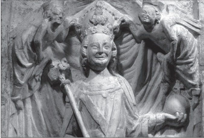
1. kép Bajor Lajos domborműve a nürnbergi városházán

A Bajorországgal szomszédos Baden-Württembergben hatszázadik évfordulója alkalmából a konstanzi zsinatot emelték idén az érdeklődés középpontjába. Míg ez utóbbi esemény a magyar történészek körében – és Husz János megégetése kapcsán talán a szélesebb közönség számára is – jól ismert, korántsem mondható el ugyanez a regensburgi kiállítás „főhőséről”. Ki is volt Bajor Lajos? Miért, milyen szempontból fontos; fontos-e egyáltalán számunkra személye és uralkodása? Alakja és története több szempontból is figyelmet érdemel. A 14–15. századot az Észak-tengertől Rómáig, a Rajnától az Elbáig, olykor a Lajtán túl is a Luxemburgok, a Wittelsbachok és a Habsburgok hármasságának vetélkedése jellemezte. Mindegyik dinasztiának az volt a célja, hogy a másik kettő fölébe kerekedjen. S jóllehet a hatalmi aspirációk rendszerint a Magyar Királyság határain kívül zajlottak, az ország néha mégis az események homlokterébe került. Ne felejtjük el, hogy 1305-ben Székesfehérvárott egy bajor herceget – III. Ottót – koronáztak magyar királlyá, aki haláláig, 1312-ig viselte is címét. Továbbá Luxemburgi Zsigmond 1387. évi magyarországi trónra kerülése fontos állomását jelentette a három dinasztia hatalmi vetélkedésének, ennek köszönhetően ugyanis – a Habsburgok és a Wittelsbachok legnagyobb bosszúságára – a Luxemburgok közép-európai pozíciói minden eddiginél erősebbé váltak.