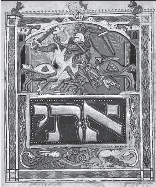
2. kép A mühlendorfi csata a budapesti Kaufmann-gyűjtemény egyik héber kéziratában (MTA KIK MS. A 384, fol. 13v)

nem nézte jó szemmel, hogy az általa el nem ismert uralkodó pápai jóváhagyás nélkül hozza meg döntéseit. Talán e szint mondható a kiállítás legkevésbé változatos egységének: a látvány gyakorlatilag üvegablakok és oklevelek váltakozására épült. A negyedik, „Császárok vagyunk” ( Wir sind Kaiser ) elnevezésű emeleten a kormányzás gyakorlati oldalát ismerhette meg a közönség. A 33 esztendőnyi uralkodás alatt Lajos egyes számítások szerint legalább 80 ezer kilométert tett meg, az általa felkeresett európai településeket a rendezők térképen is megjelenítették. Sajnos azonban az összesítés nehezen áttekinthetőre sikeredett. Ugyanebben a szekcióban kaptak helyet a családtagokkal történő kiegyezések is. Ugyancsak itt állították ki a rendezők a 19. század elején lebontott mainzi Kaufhaus am Brand homlokzatán álló nyolc dombormű (Bajor Lajos, valamint a hét választófejedelem) élethű másolatát is.