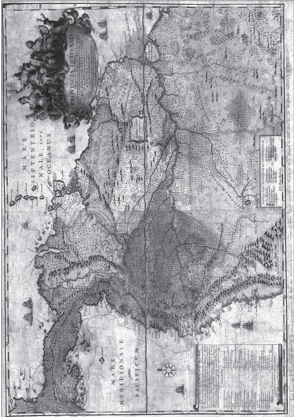
2. kép. A maynasi jezsuita missziós kerület ábrázolása a Provincia Quitensis című térképen