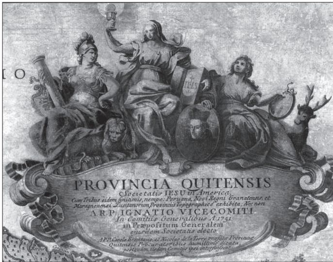
4. kép. Brentán Károly és Nicolas de la Torre 1751-ben készült térképének kartussal ékesített címe

által készített térképek egyrészt az Ad maiorem Dei gloriam jelmondat szellemében a teremtett világ sokszínűségét és végtelenségét kívánták hangsúlyozni, ezzel is Isten hatalmát dicsőítve, másrészt pedig egyetemes információs és oktatási célokat szolgáltak mind a renden belül, mind azon kívül. 63