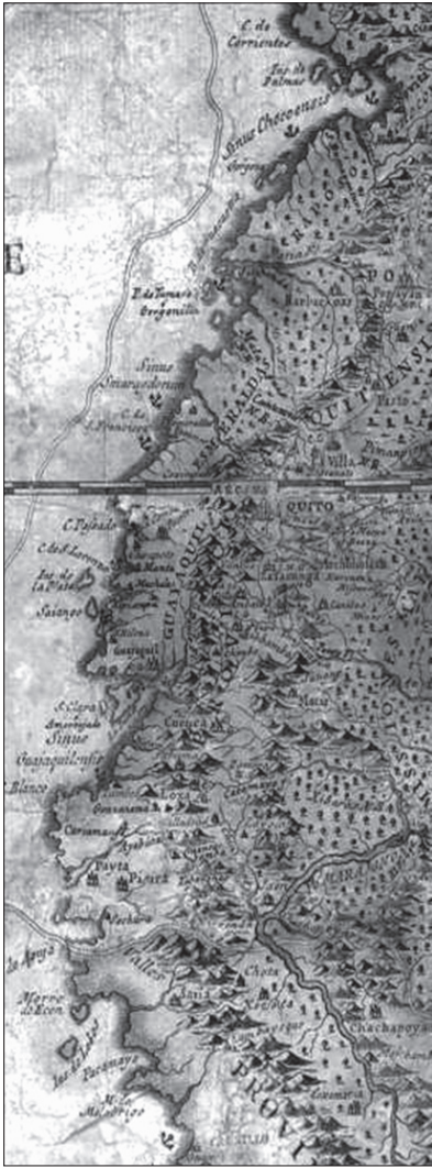
5. kép. Az Észak-Andok régió és a csendes-óceáni partvonal ábrázolása a Provincia Quitensisben

noco menti missziók egyik előjárója fedezett fel. E csatlakozást mindkét munka úgy tüntette fel, mintha a Negro az Orinoco folyóból, mintegy mellékágként válna le, ugyanakkor 1800-ban a neves berlini születésű természettudós, Alexander von Humboldt orinocói felfedezőútja során megállapította, hogy a két folyónak nincsen