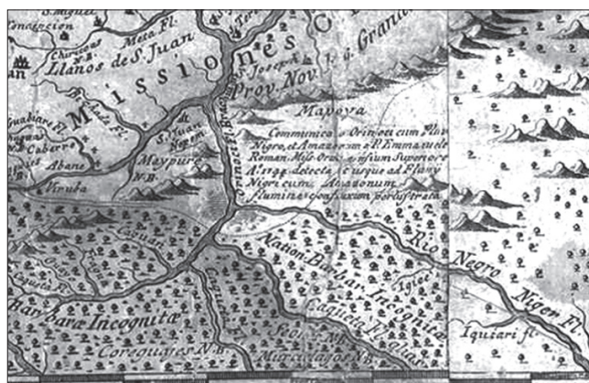
6. kép. Az Orinoco és a Negro folyók Provincia Quitensisen ábrázolt összefolyása

direkt összefolyása, őket csupán egy rövidebb, 320 kilométer hosszú természetes csatorna, a Felső-Orinocóból eredő Casiquiare folyó köti össze.